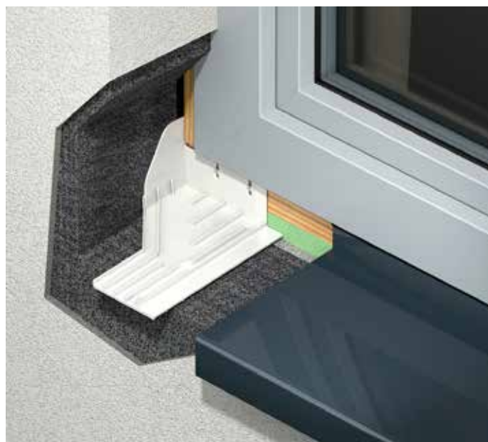
Gutmann veepileki äravoolusüsteem „Delta“

orienteeruvalt kell 15:00 esitan omapoolse ettekande. Seminar on küll tasuline, aga tõsiste huvilistele ja vabade kohtade olemasolul olete oodatud kuulama. Esitlus toimub Eesti Näituste messikeskuse A-halli 1. korruse suures auditoriumis.