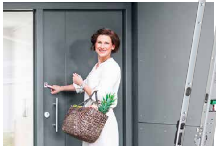
Fuhr Multitronic 881

Iga kodu juures on üli- malt tähtis turvalisus, mugavus ja säästlikkus ning suur roll kõige sel-