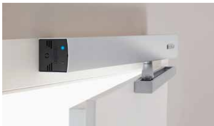
GEZE käändukseautomaatika Powerturn

Powerturn-automatika kasutusvõimalused: sise- ja välisüksed, hotellid, hooldekodud, kauplused, haiglad, toidutööstus, kodu ja kontor.