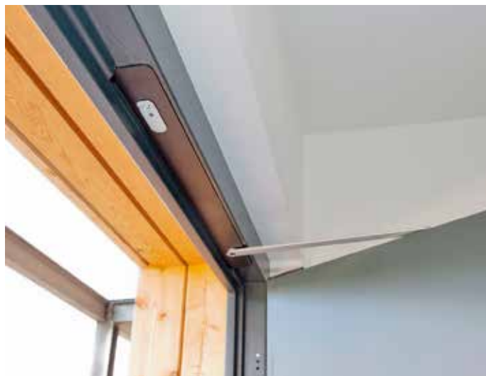
GEZE integreeritud käänduste automaatika