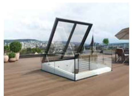
Lamilux Flat Roof Exit Comfort Square ei võta avatuna rohkem ruumi kui suletuna.