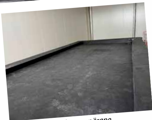
...ning tulemus oli suurepärane.

Firestone RubberGard EPDM on valmistatud etüleenpropüleen-dieenmonomeerist, mis tagab membraanidele maksimaalse vastupidavuse osoonile, UV-kiirgusele ning nii madalatele kui kõrgetele temperatuuridele. Tänu sellele on kattematerjali eluiga vähemalt 50 aastat. Lisaks ei vaja materjal peale paigaldust peaaegu mingit hooldust.