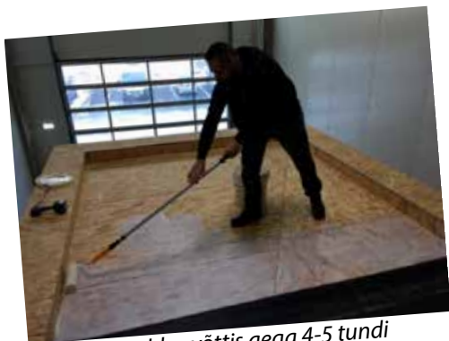
Näidispaigaldus võttis aega 4-5 tundi

Äärmiselt kuluefektiivse ja vastupidavana on ennast tõestanud Firestone RubberGard EPDM kummist lamekatuse kattematerjal. Täna on sellega kaetud juba üle miljardi ruutmeetri katusepinda. Lihtne paigaldus, madalad hoolduskulud ning ülim vastupidavus on muutnud Firestone RubberGard EPDM kattematerjali eelistatud valikuks tööstus- ja ärihoonete katuste katmisel kõikjal maailmas.