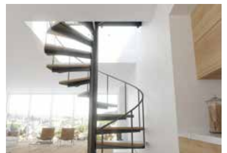
Terrassiakna ruudukujuline kuju võimaldab kasutada ruumisäästlikke spiraaltreppede.