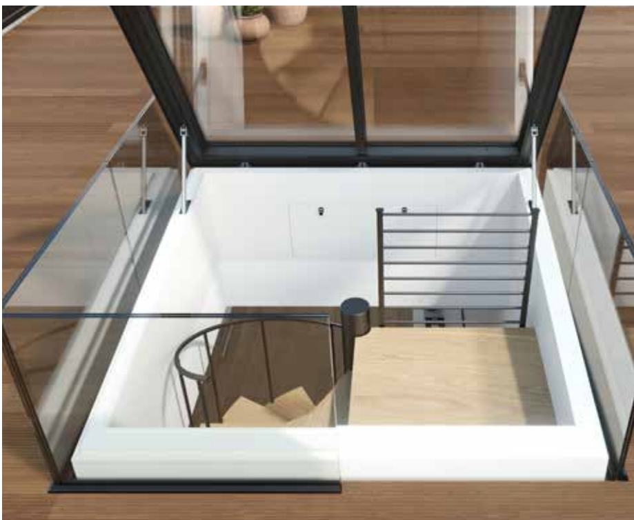
Terrassiakna suurus võimaldab mugava liikumise nii terrassile kui terrassilt tagasi tuppa.